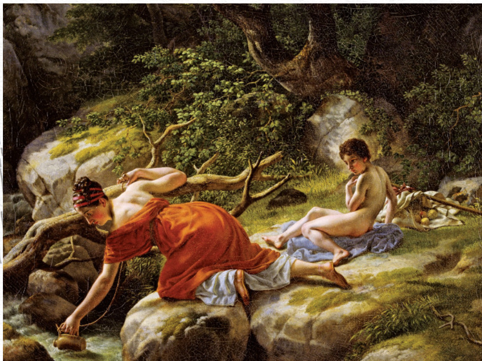
Hagar og Ismael i ødemarken – malet af C. W. Eckersberg

August - September - Oktober - November 2021