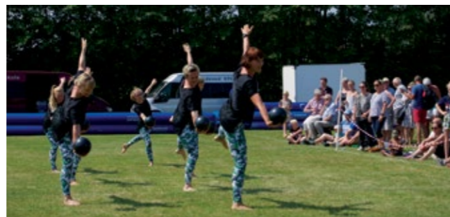
Gymnastikopvisning til sommerfesten 2018