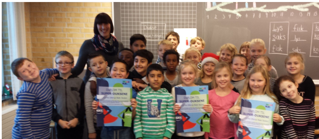
Eleverne i 3.d – de sejeste mælkedukse i Danmark