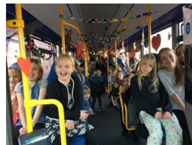
2. og 6. årgang har pyntet bussen op til jul