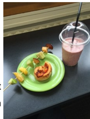
Eksempel på udbuddet i 10-pausen