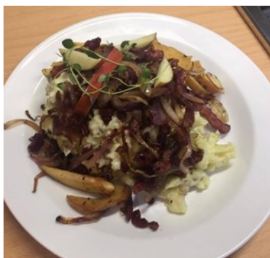
En frokost fra elev-caféen til et møde på kontoret

I samarbejde med Mesterkok-linjen har vi lavet et samarbejde med et supermarked om ”Mad-spild”, og det betyder, at vi gratis kan afhente diverse madvarer til brug i vores køkken. Det har vist sig at være en fantastisk idé, som jeg vil fortælle mere om på et senere tidspunkt.