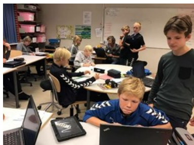
6. årgang skriver avis

Her lidt billeder fra vores seneste opslag: