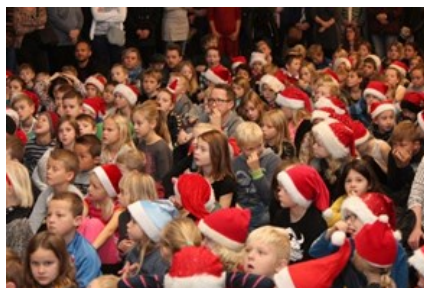
Samling før juleklippedagen