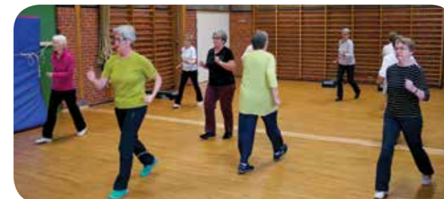
Frisk gang på gymnastikholdet Stolegymnastik