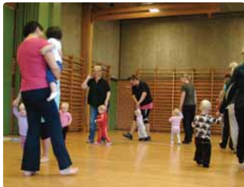
Forældre / barn

Den nye sæson i BPIs gymnastikafdeling er i fuld gang lige fra opstarten i uge 36.